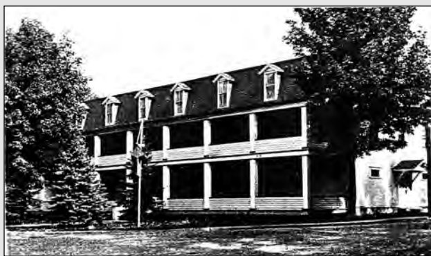
Gallagher's Hotel in the 50's, now a parking lot in Philipsburg

Back in the fifties, the town of Philipsburg was a great place to be. Everything was booming. There was a marble quarry that employed between 150 to 200 people.